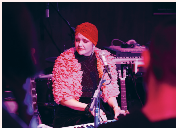
Die Nowak © Ulrich Leitner