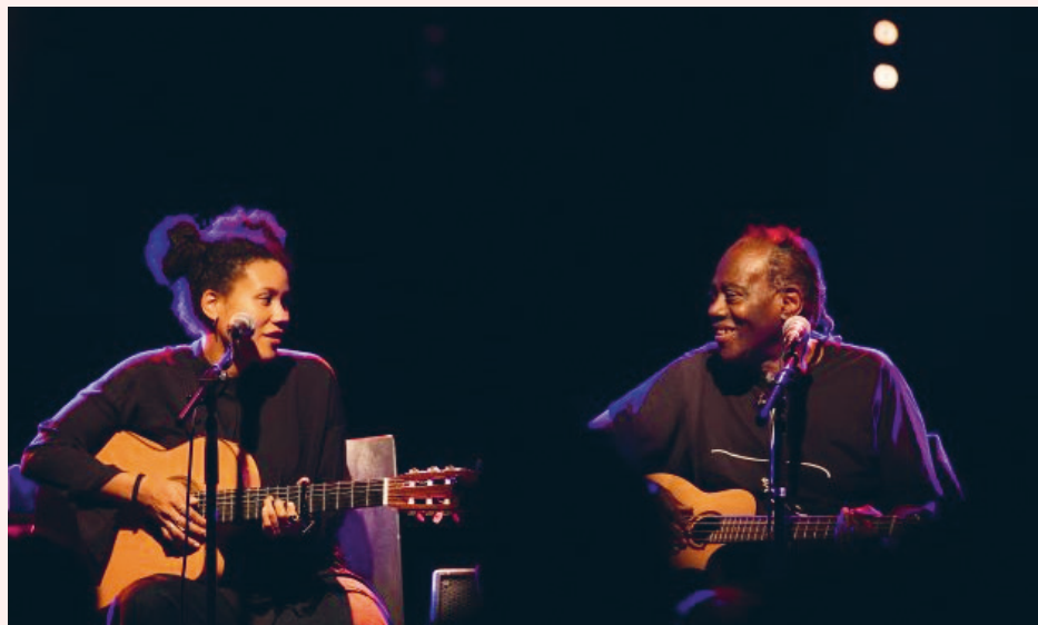
Ami Wally Warning

Live: Sondermarke, Ami & Wally Warning, Skyline Green