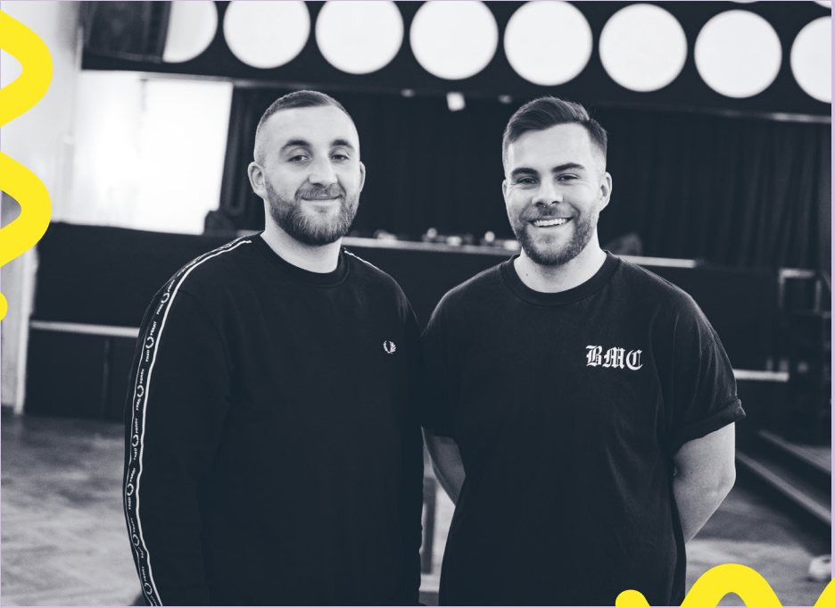
Thimeo & Mario Donhauser © Mixed Media Arts Amberg